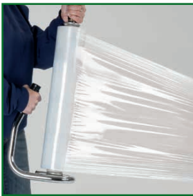
leichte Handhabung durch geringes Gewicht