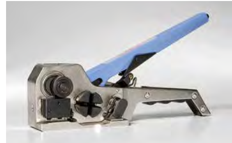
Einhebel-Kombigerät OR 4000