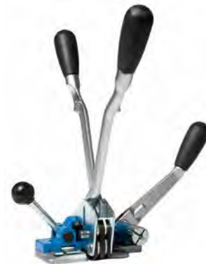
Spann- & Verschlussgerät PLR