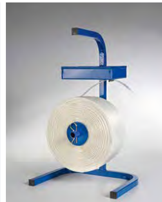
tragbare Ausführung, Art.-Nr. 12971