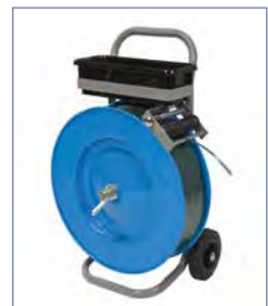
passender Abrollwagen, Art.-Nr. 40536