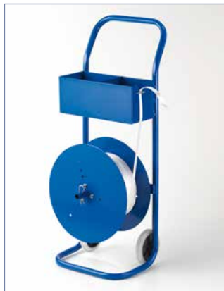
fahrbare Ausführung, Art.-Nr. 25851