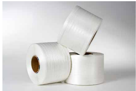
lieferbar auch als Ballenpressenband 9 / 13 / 16 / 19 mm für den Einsatz in allen üblichen Ballenpressen